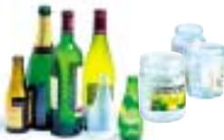
Bouteilles, bocaux et pots