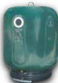
Conteneur à verre

Un mauvais tri affecte l'ensemble des résultats d'un secteur.